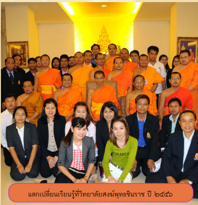
แลกเปลี่ยนเรียนรู้ที่วิทยาลัยสงฆ์พุทธชินราช ปี ๒๕๕๖

ในปีการศึกษา ๒๕๕๖ เพื่อร่วมแลกเปลี่ยนประสบการณ์การดำเนินการประกันคุณภาพการศึกษากับส่วนงานจัดการศึกษา กองวิชาการ สำนักงานอธิการบดี ได้จัด “โครงการแลกเปลี่ยนเรียนรู้เพื่อพัฒนางานประกันคุณภาพการศึกษาของส่วนงานจัดการศึกษา” โดยมีวัตถุประสงค์รับทราบปัญหาและอุปสรรค พร้อมทั้งแสวงหาแนวทางพัฒนาการดำเนินงานด้านประกันคุณภาพการศึกษาร่วมกัน